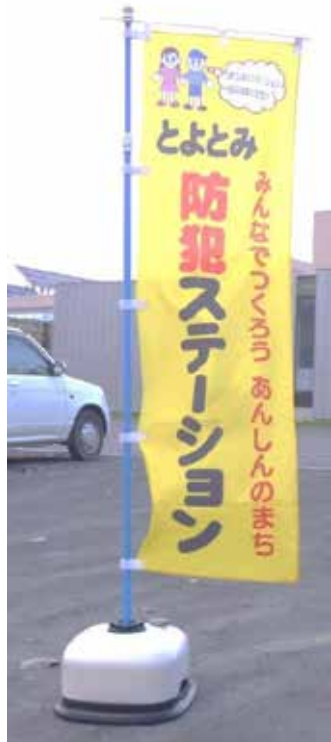
↑ この旗を見つけてね！ 防犯ステーションの目印となるのぼり

防犯カメラで監視しているから犯罪ができないと不審者側に思わせるためにも盲点のないような設置を検討してください。通学路すべてを防犯カメラ等で網羅できるようにしないと、結局は子ども達が危険にさらされることになりません。