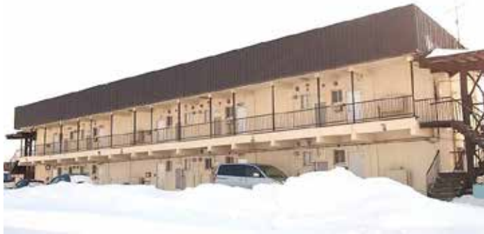
↑改修のあった職員住宅(独身寮)

・ふるさと応援寄附金 事業 2億2499万4000円 ・豊富町酪農業振興促進支援事業 1038万8000円