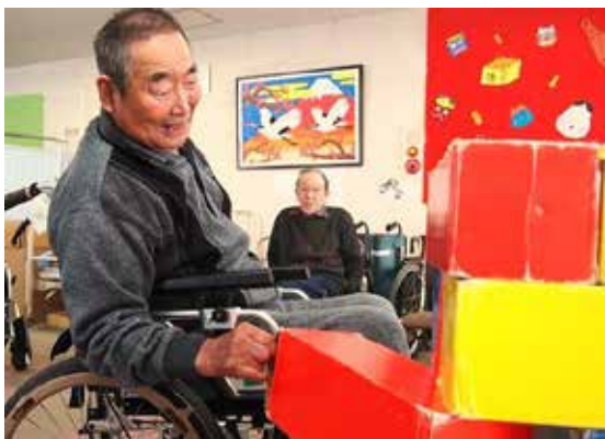
↑ デイサービスセンターでレクリエーションを楽しむ利用者

審議会では子育てにつ て多くご意見頂いている。 子育て世代の委員からは ファミリーサポートとい つた、地域で年配の方のお手 伝いができるような方を登 録する制度が出来ないだ ろうか等、今必要とされて いるようなご意見を頂いた。 審議会での意見は各課また は専門部会でもお話しして いるため、今後は施策の展 開での議論になってくるか と思われ。